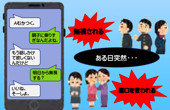
口裏を合わせた仲間はずれ